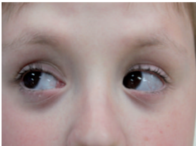
Figura 1. Imagen de las escleróticas azules.

Las manifestaciones que sufren los pacientes pueden agruparse en esqueléticas y no esqueléticas. Dentro de las primeras, se encuentra principalmente la fragilidad ósea y la reducción en la masa ósea mineral, que condicionan la presencia de fracturas. Las no esqueléticas incluyen el color azulado de las escleróticas (Figura 1), la dentinogénesis imperfecta, la hiperlaxitud ligamentosa o la presencia de huesos wormianos entre las suturas craneales 2 .