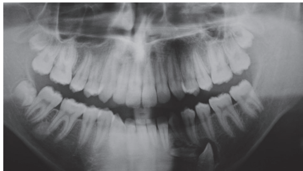
Fig. 1. Ortopantomografía.

En la exploración extraoral no presenta asimetría facial, ni dificultad para la apertura bucal. No refiere dolor, ni sintomatología asociada. A la exploración intraoral se observa la persistencia del 73 y la ausencia del 33. A la palpación, se aprecia una tumefacción de consistencia dura en el cuerpo mandibular izquierdo. Se solicita una prueba radiológica complementaria, tipo ortopantomografía (Figura 1) y una Tomografía Axial Computarizada (TAC) mandibular (Figura 2), que revelan la retención del 33 a causa de un supernumerario en posición horizontal asociado a un odontoma.