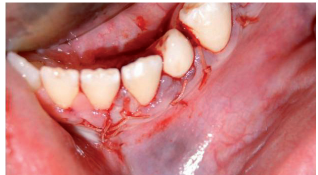
Fig. 6. Cierre con sutura reabsorbible.