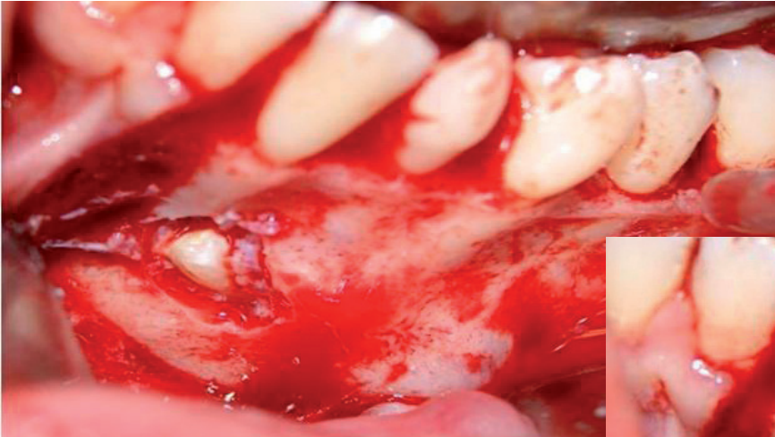
Fig. 3. Despegamiento mucoperióstico.

Se prescribe tratamiento ambulatorio de: antibiótico (Amoxicilina 875/125 mg, uno cada ocho horas, siete días), antiinflamatorio (Ibuprofeno 600 mg, uno cada ocho horas, cinco días), analgésico (Metamizol magnésico 575 mg, alterno con el Ibuprofeno 600 mg cada cuatro horas) y un protector gástrico (Omeprazol 20 mg, 1/12 h, siete días) por vía oral. Se cita una semana después para revisar la cicatrización. Actualmente se encuentra asintomático.