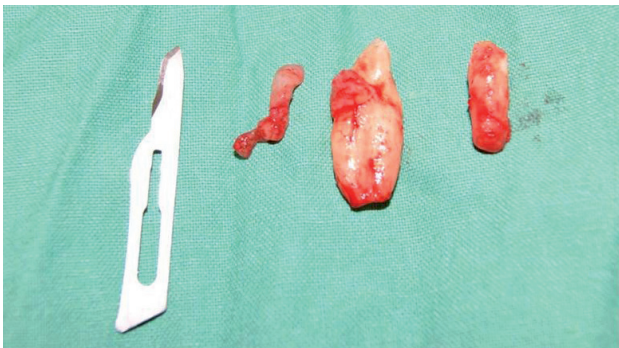
Fig. 5. Canino, odontoma y supernumerario exodonciado.