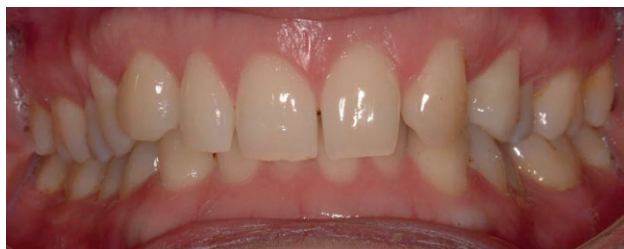
Figura 1. Exploración clínica intraoral inicial en oclusión.

Finalizado el tratamiento con ortodoncia (Figuras 3, 4 y 5), y una vez que el paciente optó por la opción del implante; se repitió el escaneado intraoral y se obtuvo un escáner de haz cónico para la correcta planificación de la cirugía implantológica (Figura 6).