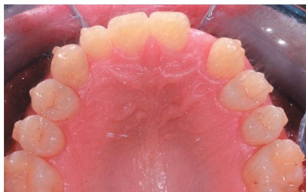
Figura 4. Exploración clínica intraoral de arcada superior post tratamiento ortodóncico.