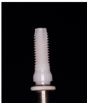
Figura 7. Implante de circona de 3.6 x 10 mm.