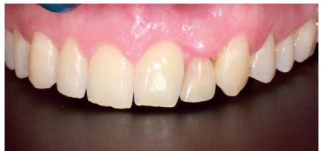
Figura 11. Imagen clínica intraoral a 8 semanas de evolución.