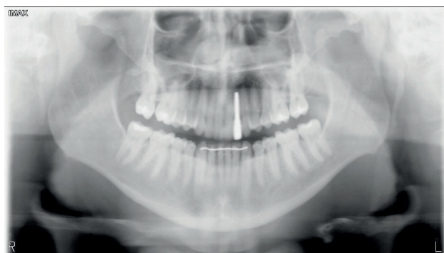
Figura 13. Radiografía panorámica a 12 meses de evolución.

tados. Sin embargo, son varias las desventajas de este tipo de prótesis, como los problemas de adaptación por dificultades fonéticas y masticatorias. Además, la estética puede verse comprometida debido a la presencia de retenedores, si estos son metálicos.