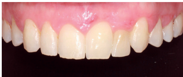
Figura 12. Imagen clínica intraoral con corona definitiva, a las 3 semanas.

La indicación de una prótesis parcial removible para el reemplazo de un solo diente es una opción recomendable cuando el paciente dispone de recursos económicos limi-