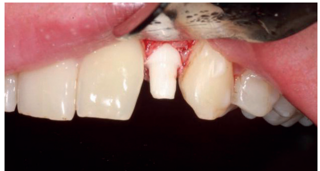
Figura 9. Imagen intraoperatoria de la colocación del implante de circona.

Tras 4 meses de la colocación del implante de circona y la corona provisional (Figura 12), se procedió al escaneado intraoral del muñón para la confección de una corona de circona monolítica.