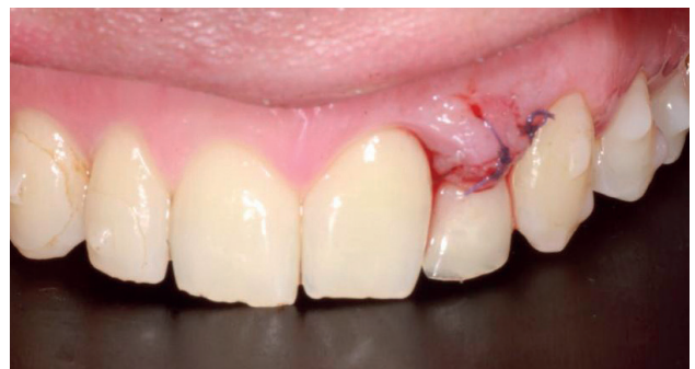
Figura 10. Imagen clínica intraoral en el postoperatorio inmediato.