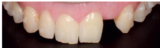
Figura 5. Exploración clínica intraoral de arcada superior postratamiento ortodóncico.