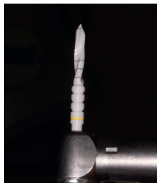
Figura 8. Fresa de circona de 3 mm.

Tras la colocación del implante (Figuras 9 y 10), se rebasó el provisional con resina acrílica autopolimerizable (Bosworth Trim, Bosworth Company) y se cementó mediante un cemento de resina dual (RelyX Unicem 2, 3M Espe, 3M, Saint Paul, Minnesota, USA). Posteriormente, se comprobó la oclusión con papeles de articular de 12 y 8µm con el objetivo de que el provisional no tuviera contactos ni en máxima intercuspidación ni en guía anterior ni guía canina, y no se modificó durante los 4 meses siguientes, aunque sí se revisó al paciente durante el periodo de osteointegración, a las 8 semanas de maduración de los tejidos blandos (Figura 11).