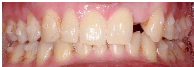
Figura 3. Exploración clínica intraoral en oclusión post tratamiento ortodóncico.