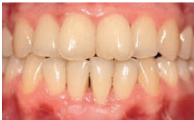
Figura 4. Aspecto de la cicatrización tras cuatro semanas.