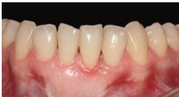
Figura 6. Resultado final tras un seguimiento de dos años. Observamos cierto fenómeno de "creeping attachment".

A la paciente le preocupaba sobre todo la salud de sus encías, refería problemas de sensibilidad dentinaria y dificultad en el control de placa bacteriana.