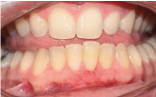
Figura 10. Control tras quince días, obsérvese la epitelización del área cruenta apical al sobre y la creación de nueva banda de tejido queratinizado.