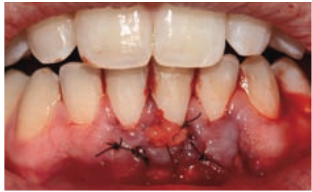
Figura 9. Adaptación y sutura del ITC.