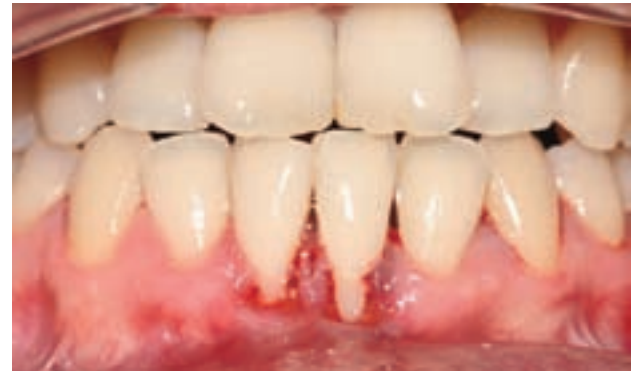
Figura 2. Aspecto clínico tras raspado y alisado radicular. Recesión de Miller clase III.