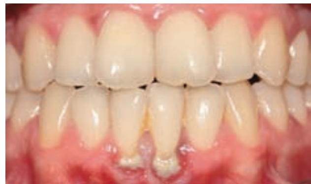
Figura 1. Estado preoperatorio de dientes 41 y 31. Presencia de placa y cálculo.