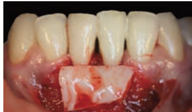
Figura 3. Despegamiento del colgajo a espesor parcial y posicionamiento del IGL sobre el lecho receptor.