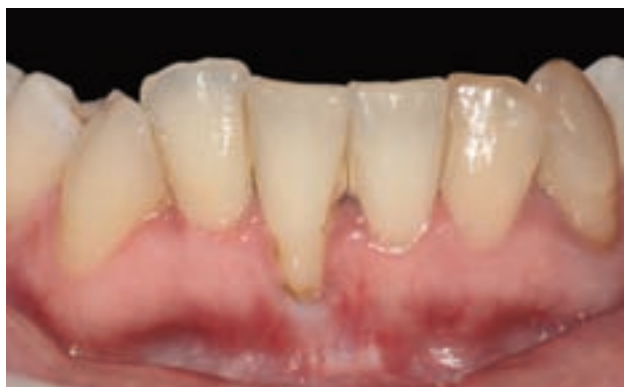
Figura 13. Situación inicial: recesión clase III de Miller en diente 41.