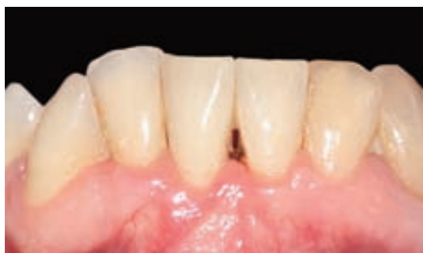
Figura 17. Resultado final tras un seguimiento de ocho meses. Obsérvese la creación de nueva banda de tejido queratinizado.

La técnica quirúrgica comenzó con la preparación del lecho, realizando una descarga lateral que sobrepase la línea mucogingival (Figura 14), (dicha descarga se realizó a espesor total). El despegamiento del colgajo debe ser uniforme y en un plano hasta llegar a la base del colgajo donde liberamos periostio hasta que observemos que la movilidad del labio no comprometa la estabilidad del injerto.