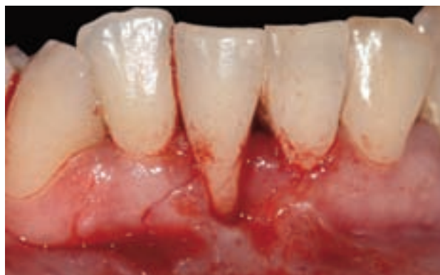
Figura 14. Incisión a espesor total, esta incisión debe atravesar la línea mucogingival.