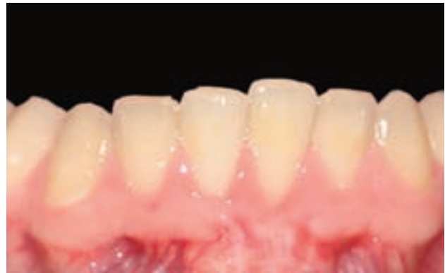
Figura 11. Imagen clínica tras seis meses de cicatrización.