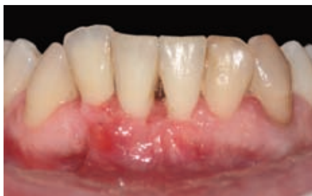
Figura 16. Aspecto de la cicatrización a los quince días.

de sensibilidad en la zona anteroinferior. A la paciente le preocupaba que la encía siguiese retrayéndose.