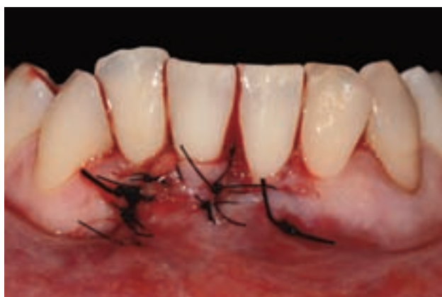
Figura 15. Situación tras el desplazamiento lateral del colgajo a espesor total e incorporación del ITC. El colgajo queda cubriendo totalmente el ITC.