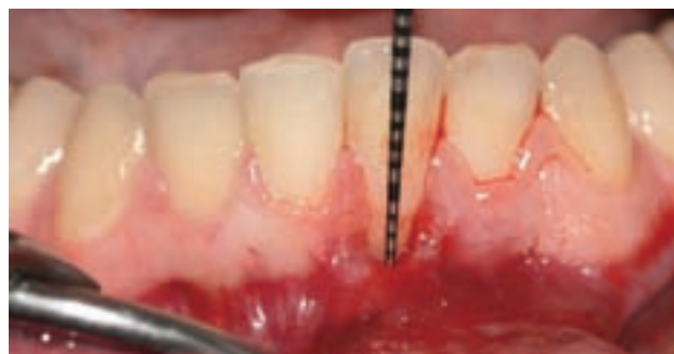
Figura 7. Recesión de Miller clase II en diente 31. Obsérvese la tracción que ejerce el frenillo.

A la exploración clínica presenta recesión gingival en el diente 31. En la imagen (Figura 7) podemos apreciar nula o inexistente banda de encía queratinizada, mínima profundidad de vestíbulo y un frenillo de inserción alta.