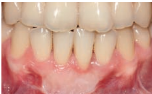
Figura 5. Imagen de control al año.