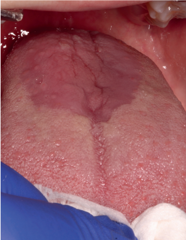
Figura 3. Candidiasis eritematosa.

culturales 15 , el ALA y el clonazepam tópico podrían ser las mejores opciones para comenzar.