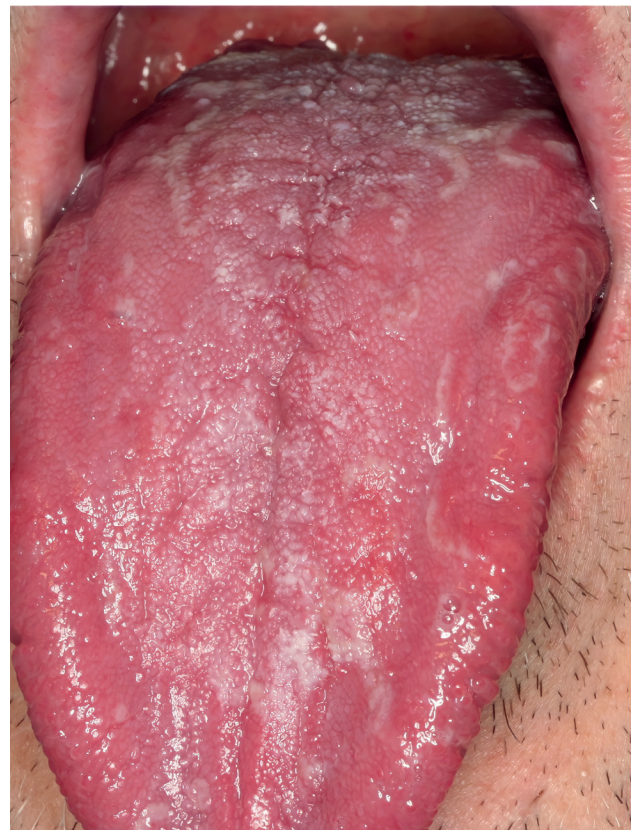
Figura 2. Lengua geográfica.