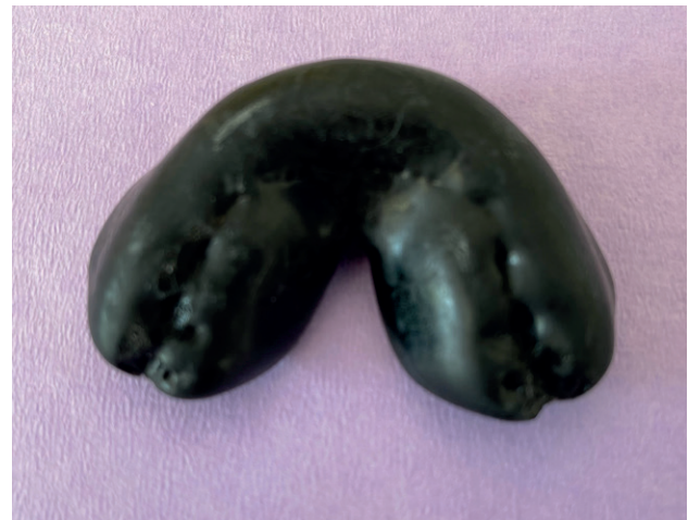
Figura 1. Protector bucal utilizado por el paciente.

La inspección intrabucal permitió observar una disminución de la apertura bucal, junto a una herida incisocontusa a nivel de la cara interna del labio inferior, la cual fue suturada en urgencias. Al observar la oclusión se vio que el paciente presentaba ligera luxación palatina de los dientes