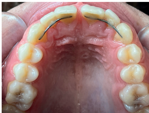
Figura 5. Ferulización del sector anterosuperior.

signos y síntomas de necrosis pulpar, verificando la vitalidad de todo el sector anterosuperior, así como la ausencia de cambio de color del mismo. Además, tras haber desaparecido el trismo producido tras el traumatismo, se realizó la exploración clínica de la ATM, la cual resultó normal, por lo que se descartó la necesidad de exploración imagenológica de la misma.