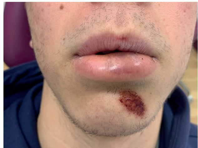
Figura 2. Edema labial inferior acompañado de herida erosiva cutánea en región mentoniana izquierda.