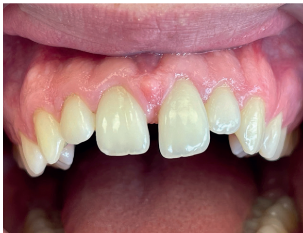
Figura 3. Ligera luxación extrusiva del incisivo central superior izquierdo.

El paciente fue revisado a los 7 días, en los que el edema labial disminuyó de forma considerable, se produjo la cicatrización de la herida erosiva extraoral y se descartaron